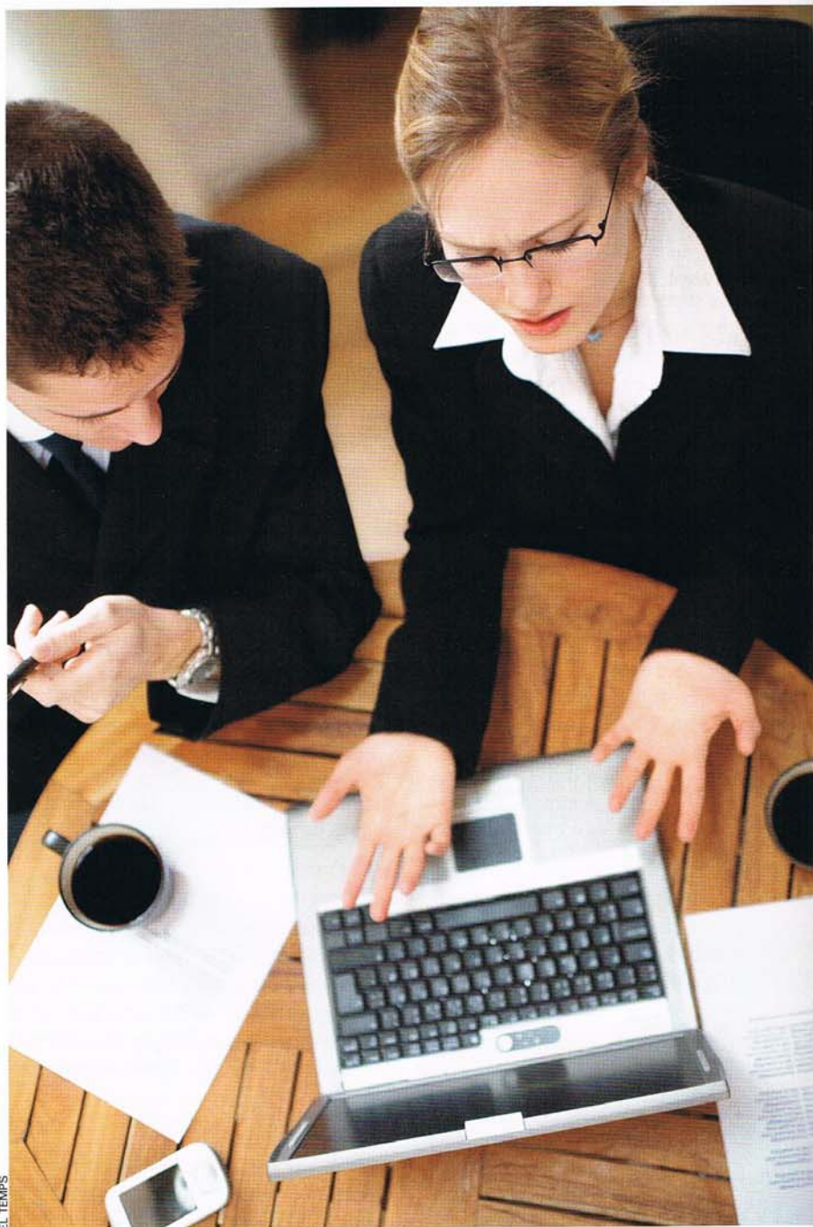
La comissària Viviane Reding vol que les empreses s'acollesquen a un compromís voluntari perquè el 30% dels membres del consell d'administració, l'any 2015, siguin dones.

E l Fons Monetari Internacional (FMI) tindrà nou director executiu a partir del 30 de juny. Després de l'abrupta sortida de Dominique Strauss-Kahn, el banc de bancs busca un pilot per als anys vinents. I de moment tots els analistes apunten que Christine Lagarde és qui té més possibilitats de comandar la nau. Si supera l'altre candidat en pugna, el mexicà Agustín Carstens, la ministra d'Economia francesa es convertirà en la primera dona a dirigir l'FMI i, de retruc, esdevindrà la primera que s'encimbellarà al capdamunt de les institucions que regeixen l'esdevenidor econòmic-financer del planeta. La fita no és pas poca cosa. Fins ara la gestió de l'economia havia estat vedat de la testosterona. Si bé aquests darrers decennis les dones han assolit quotes de participació cada volta més importants en la vida pública,