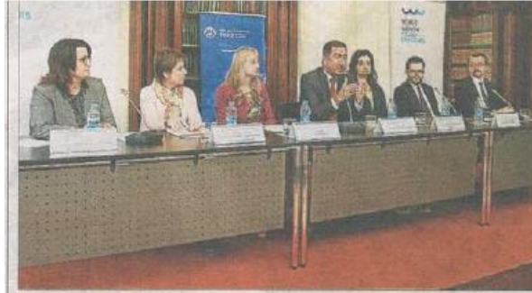
Jornada de presentación del proyecto en el Palau de Pedralbes