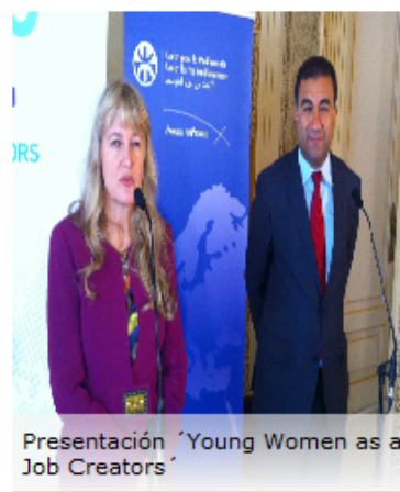
Presentación 'Young Women as a Job Creators'

Según han explicado este martes los responsables del proyecto durante su presentación, el objetivo es fortalecer el papel de la mujer en la vida social y económica, promover la igualdad de género en el área del Mediterráneo y convertir a estas mujeres en "empresarias de éxito y futuras creadoras de empleo".