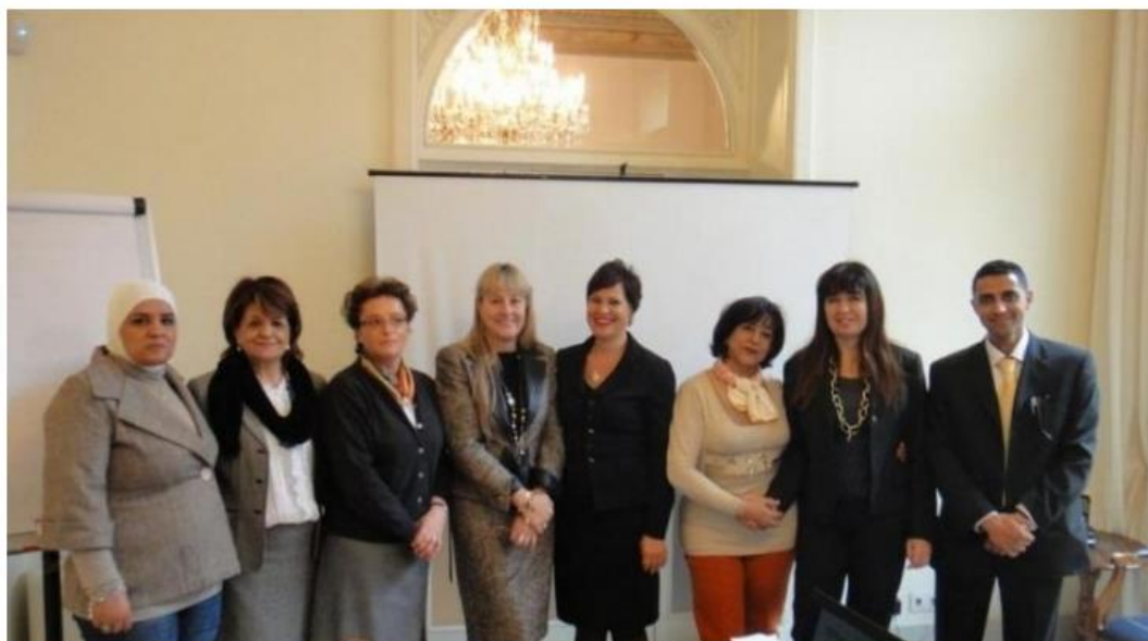
► Integrantes de la Asociación de Federaciones y Asociaciones de Empresarias del Mediterráneo

Escrito por: Redacción Miércoles, 01 de Mayo de 2013 00:17