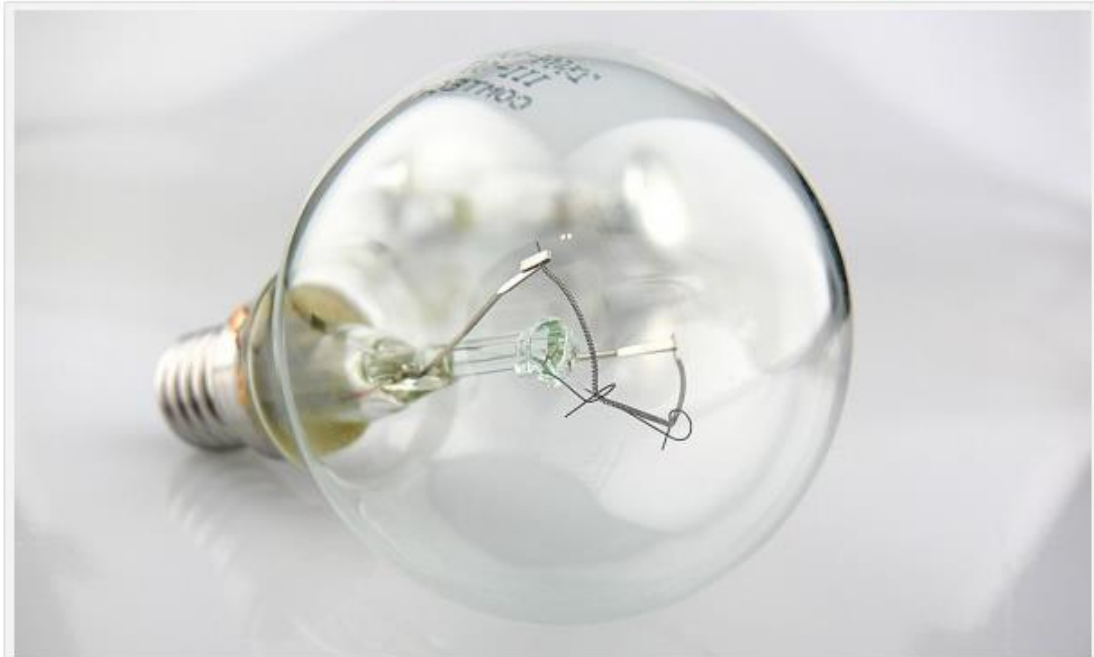
Incentivar el emprendimiento entre mujeres

El proyecto 'Young Women as a Job Creators', impulsado por la Asociación de Federaciones y Asociaciones de Empresarias del Mediterráneo (Afaemme) y la Unión por el Mediterráneo (UpM), promoverá el autoempleo y el emprendimiento entre 10.000 jóvenes universitarias de España, Marruecos, Palestina y Jordania. Mediante este proyecto se podrán dar salida a 400 iniciativas "viables" de jóvenes empresarias.