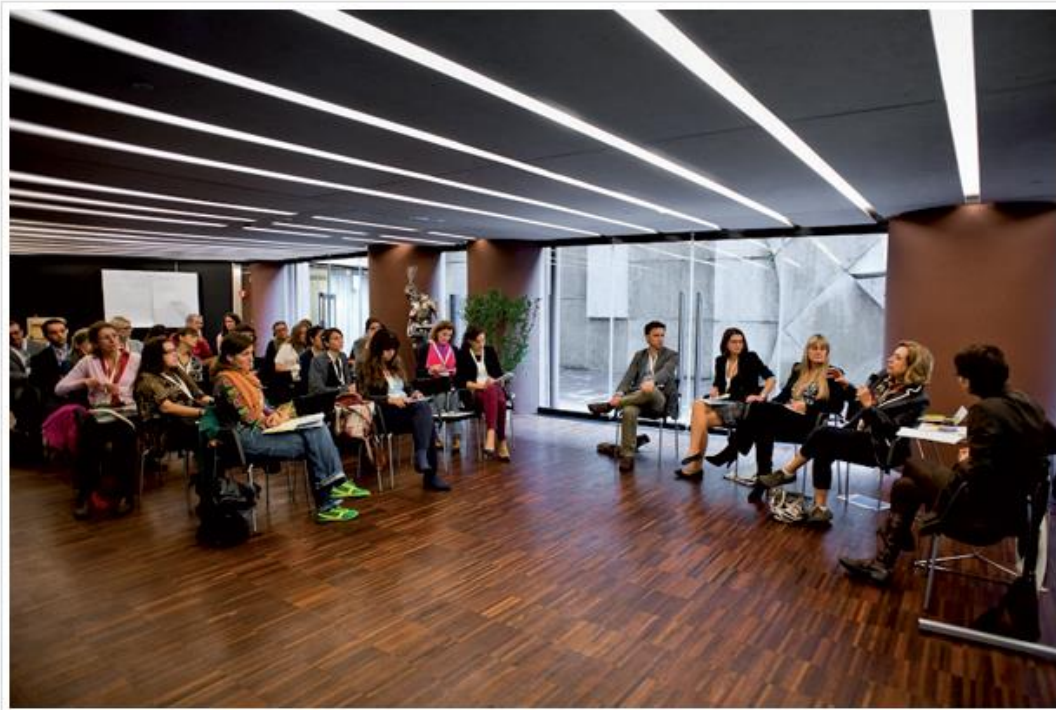
Lors d'un précédent séminaire organisé dans le cadre de l'initiative Young women as job creators.