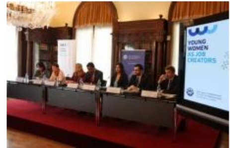
The presentation of the project at the Union for the Mediterranean's headquarters, in Barcelona